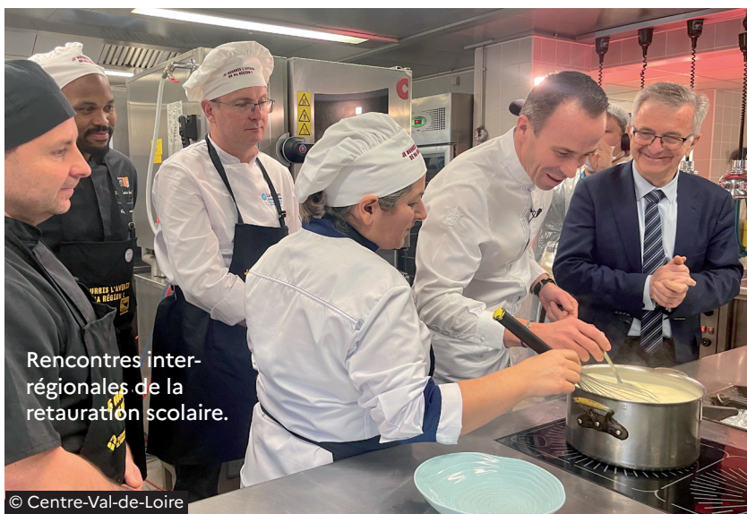
Rencontres inter-régionales de la restauration scolaire.

Cette qualité devant rester accessible, la Région Centre-Val de Loire généralise la mise en œuvre d'une tarification sociale pour les services de restauration et d'hébergement. En septembre 2025, c'est donc tous les établissements de la Région Centre-Val de Loire qui proposeront une tarification basée sur le quotient fiscal des familles.