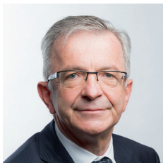
François BONNEAU Président de la Commission Éducation Orientation Formation Emploi

En cette rentrée scolaire 2025, les Régions restent engagées au service des lycéens et de l'ensemble de la communauté éducative.