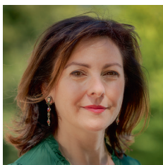
Carole DELGA Présidente de Régions de France