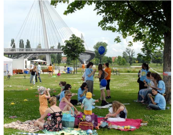
Europa-Picknick im Garten der Zwei Ufer zwischen Straßburg und Kehl.

Ziel des EGTC-Projekts ist es auch, die Entwicklung grenzüberschreitender Ballungsräume zu analysieren, um Best-Practice-Beispiele zu nutzen und „Governance-Modelle“ aufzuzeigen, die in den neuen Mitgliedsstaaten entwickelt werden können. Das Projekt wird auch untersuchen, inwieweit der EVTZ (Europäischer Verbund für Territoriale Zusammenarbeit), durch den ein einziges Gebiet