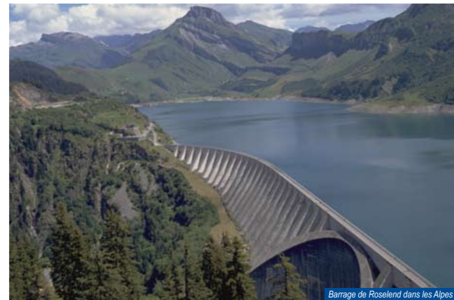
Barrage de Roselend dans les Alpes

Les énergies de la mer vont également être mises à contribution dans le cadre de la création d'un parc d'hydroliennes sur le site de Paimpol-Bréhat (Côtes-d'Armor). Cette