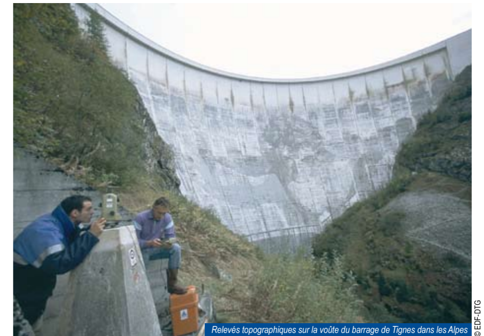
Relevés topographiques sur la voûte du barrage de Tignes dans les Alpes

Le Centre d'Ingénierie Hydraulique (CIH) propose l'expertise hydraulique d'un maître d'ouvrage et d'un maître d'oeuvre ainsi que sa connaissance pointue de la conduite et de la maintenance des ouvrages à ses clients