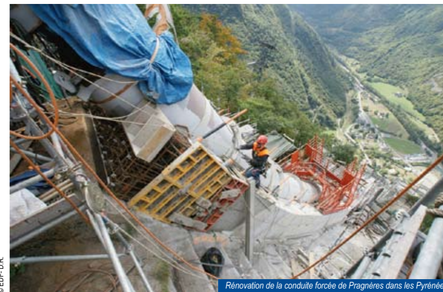
Rénovation de la conduite forcée de Pragnères dans les Pyrénées

blit, pour sa part, des diagnostics et conseille l'exploitant sur l'état des principaux composants électriques et mécaniques ainsi que des ouvrages de génie civil des centrales nucléaires, thermiques et hydrauliques. Grâce à l'expertise de ses 570 collaborateurs, DTG contribue également à la gestion des réserves en eau, au service de l'entreprise, en s'appuyant sur ses prévisions hydrométéorologiques basées sur 40 années d'expérience. DTG s'attache également à mettre en oeuvre de nouveaux services permettant de répondre aux besoins émergents de ses clients, adaptés à chaque problématique et s'appuyant sur les techniques les plus récentes. L'e-monitoring en est un exemple. Il s'agit là d'une assistance à distance aux producteurs d'énergie, par un réseau d'experts du Groupe EDF, en vue de l'optimisation de la gestion des actifs de production. Pour les équipes de production, cette assistance conduit à une amélioration des performances et de la disponibilité des installations.