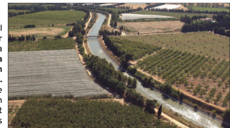
Canal Philippe Lamour

La Région met en place un observatoire régional des risques naturels, destiné à mutualiser l'information sur les risques naturels et à la diffuser auprès du plus grand nombre. La diffusion d'une véritable culture du risque est en effet indispensable à toute action de prévention. La Région appuie également les actions de sensibilisation auprès des publics scolaire afin que, dès le plus jeune âge, les citoyens prennent conscience de la réalité des risques naturels dans la région.