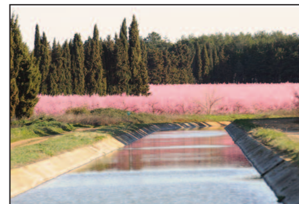
Canal de campagne

La Région Languedoc-Roussillon est la 1 ère région de France à maîtriser la gestion de l'eau, elle dispose lors du congrès d'un stand de 27m 2 qu'elle partage avec son concessionnaire, la Compagnie du Bas Rhône et du Languedoc (BRL).