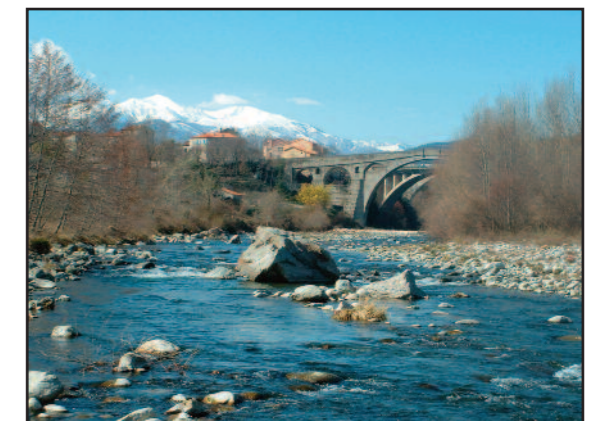
Le Pont du Diable